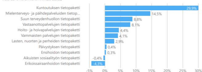
MUUTOS-% TIETOPAKETEITTAIN (€ / asukas)